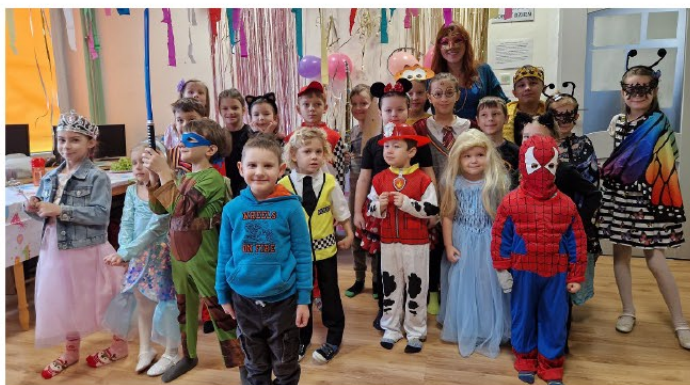
Mali uczestnicy szalonych bibliotecznych harców. Ach, co to był za bal...

W Giżycku podczas tegorocznej zimowej kanikuli można było skorzystać m.in. z ofert Miejskiego Ośrodka Sportu i Rekreacji (codzienne zajęcia na lodowisku i treningi siatkarskie), Giżyckiego Centrum Kultury (zajęcia artystyczne i plastyczne - rękodzielnicze) oraz Miejskiej Biblioteki Publicznej (dwa pękające w szwach od atrakcji tygodnie, zwieńczone fantastycznym bale). Ferie za nami, ale głowy do góry, Kochane Dzieciaki i Droga Młodzieży! Jak śpiewał kabaret OT.TO, "jeszcze tylko marzec, kwiecień, maj, czerwiec i...". Znacnie to, prawda?