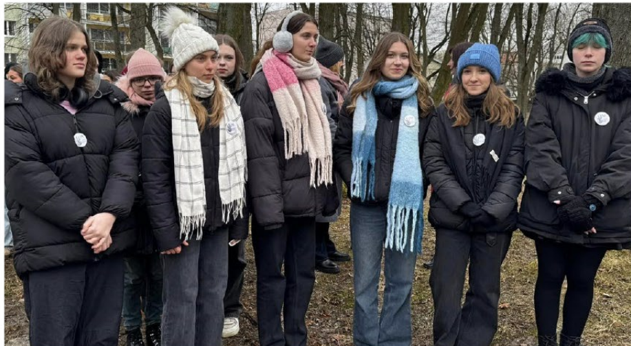
W lutowej uroczystości na cmentarzu wzięła udział młodzież z I Liceum Ogólnokształcącego