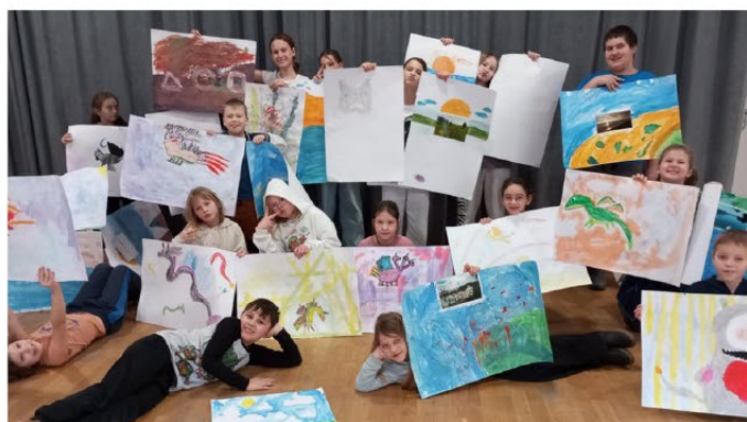
Kto wie, czy podczas ferii w GCK nie objawił się nam jakiś nowy Matejko...