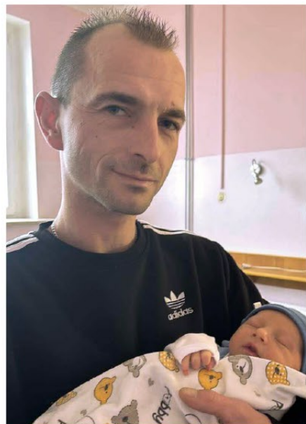
OLUŚ Z TATĄ