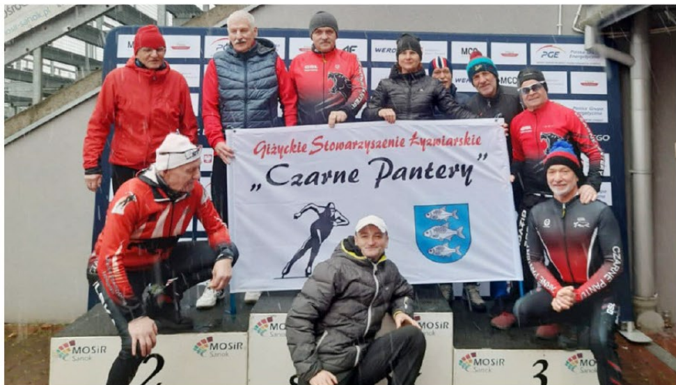
W tym sezonie giżyccy łyżwiarze po punkty Pucharu Polski dwukrotnie jeździli do Tomaszowa Mazowieckiego i raz do Sanoka. Ta fotka pochodzi z tego ostatniego

Czekamy zatem na wyniki, zamykające najnowszy rozdział w historii GSŁ. A tych, którzy chcieliby nieco zanurzyć się w historii, gorąco zachęcamy do odwiedzenia Giżyckiego Archiwum Cyfrowego (ul. Warszawska 17). Można tam bowiem obejrzeć ciekawą wystawę fotograficzną poświęconą "Czarnym Panterom" (wernisaż z udziałem dawnych i obecnych łyżwiarzy odbył się 13 lutego).